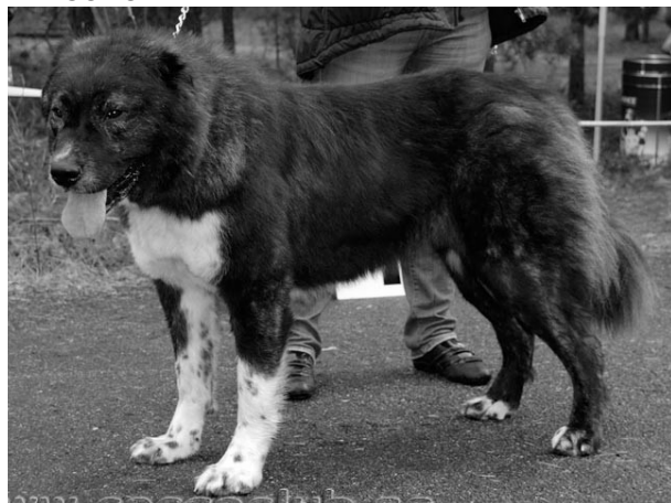
PE4, TP JUN AMAZONKA IZ STOLITSY SIBIRI