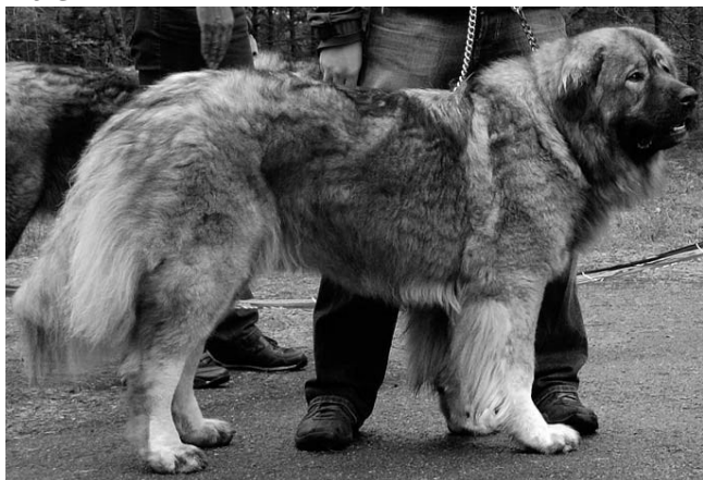
VSP, PE1 ZIMSA