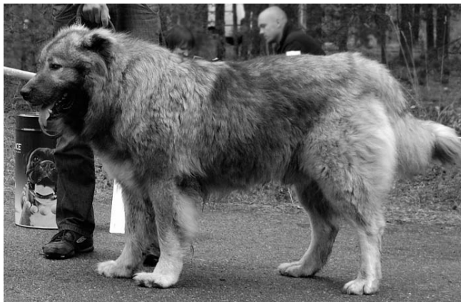
TP, PI1, TP VET CHEMI DATVI ZHUMAGALI