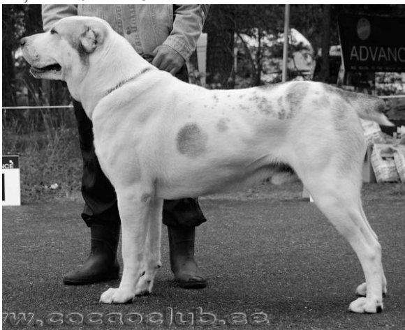
PI3 OZAR DALER AKMENU GELE