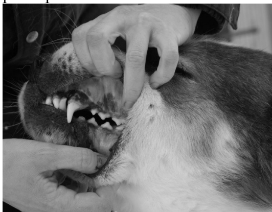
pilt 3/ рис.3