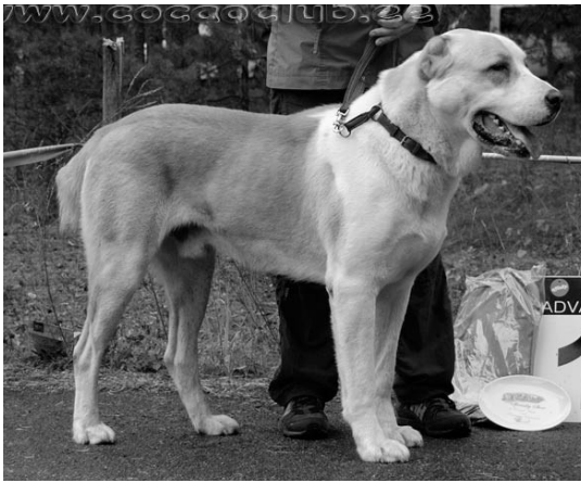
TP, P11 E-SHAHRUK