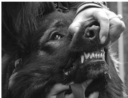
pilt 2/ рис.2