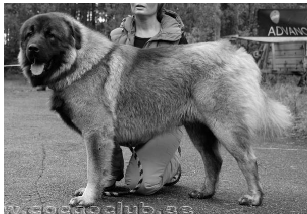
PI2 ANGELICALLY FLOSS