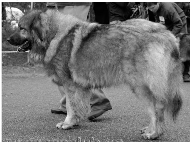
PE3 ANGELICALLY BIGGI