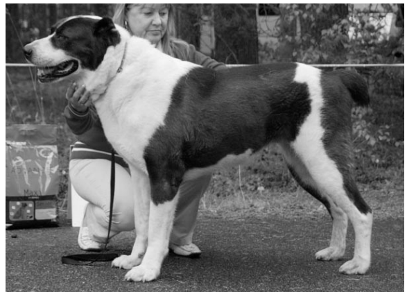
PE2, VSP VET ALMAZ