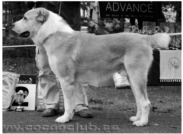
PI2, TP VET ALTŌN KYZYL-BATYR