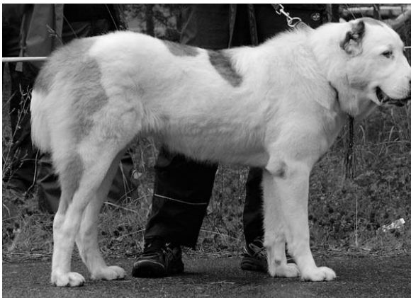
VSP, TP JUN, PE1 ALTYNBAY GYULDZHAN