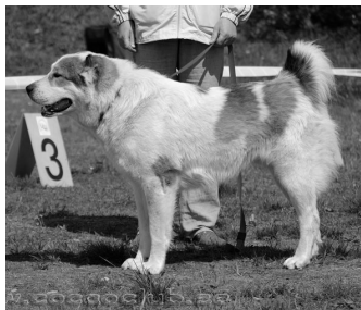
VSP, VSP JUN Altybay Gairat om.D.Vanderfiit, Tallinn