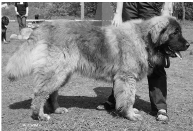
TP JUN, PI2 Barny om.G.Ruusmäe, Eesti