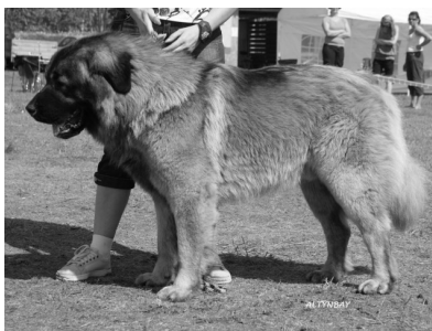
VSP, P11 Angelically Floss om.A.Timmi, Tallinn