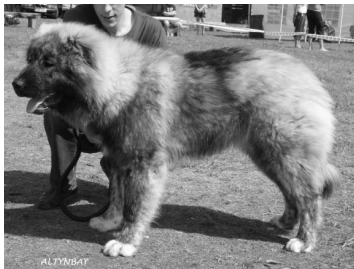
TP KUTS Grants Zaikons om.L.Kuze, Läti