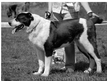
TP VET, PE4 Almas om.S.Kubpart, Tallinn