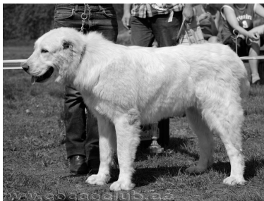
TP, TP JUN Jaunzembek Samuna om.L.Mazule, Läti