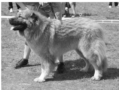
TP, TP JUN Grey Cardinal Free Cadele om.L.Kuze, Lāti

Tahan õnnitleda ka kõiki võitjaid ning öelda tänusõnad kõigile osavõtjatele, korraldajatele ja vabatahtlikele abilistele- ilma Teieta seda üritust lihtsalt ei olekski! Ja see, milline ta saab olema järgmisel korral, sõltub ainult meist endist!